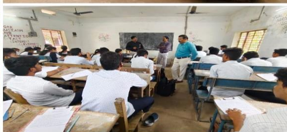
2nd Mid -Term Examinations and Principal's Visit to Exam Rooms