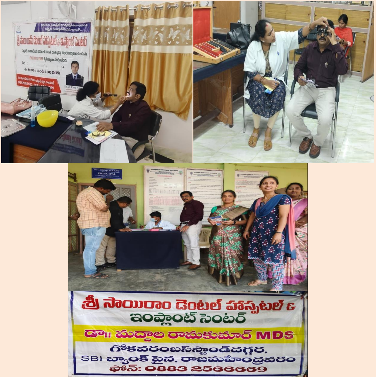
Eye and Dental Check Up done for all faculty and students by Sri Sairam Dental Hospital & Implant Centre , Rajamahendravaram