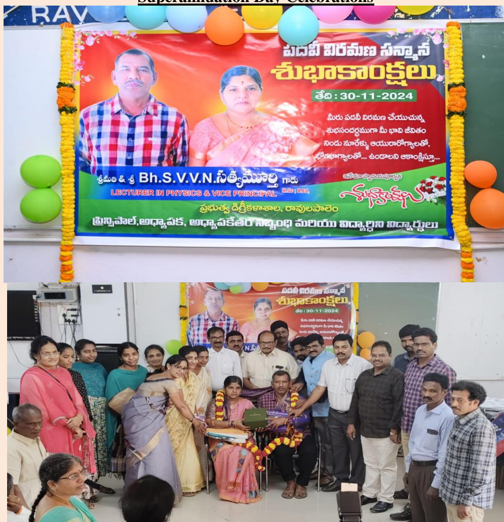
Staff felicitating Vice Principal on his Superannuation Day on 30 November 2024