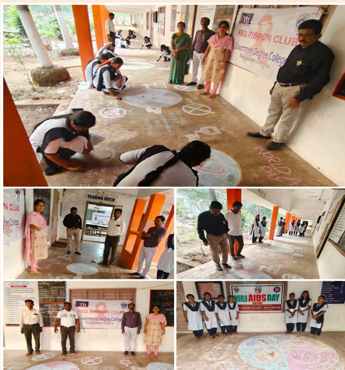
World Aids Day Event and Activities