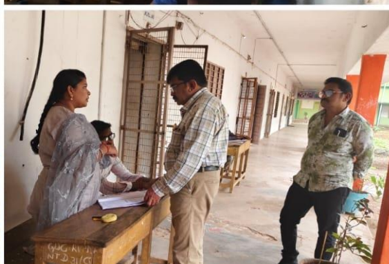
3 rd & 5 th University Sem-End Exams and Principal's Visit to Exam Rooms