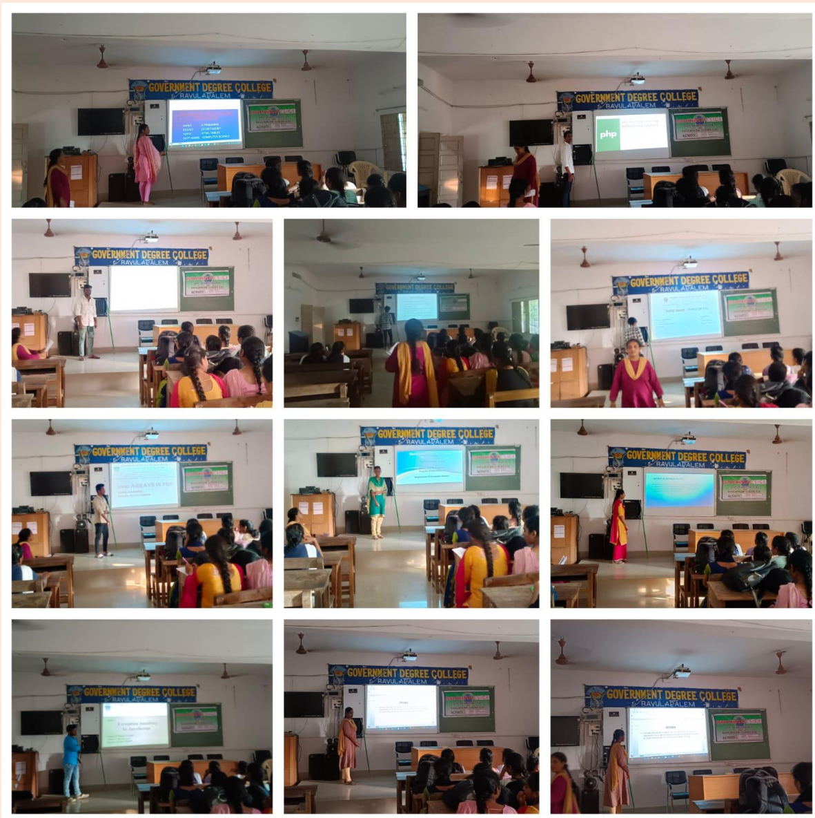
Student Seminars presented by III MPCS students through PPT