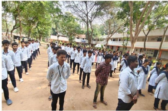
Students and Staff at General Assembly